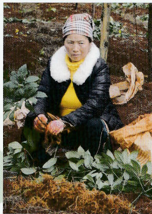
少数民族の収穫風景

特筆すべきは、現在わかっているだけで80種類のサポニンが確認され、1等級三七は鎮静型サポニンと興奮型サポニンが程よく含まれ、心を落ち着かせるのに役立つといわれています。その他、アミノ酸、三七ケトン、フラボノイド、デンシチン、ビタミン、ミネラル、等も豊富に含み、健康な体づくりに役立ちます。疲れやすい、眠りが浅い、手足が熱い、手足が冷える、短気、イライラする、赤ら顔、尿量が少ない、等こんな方々の健康に役立ちます。