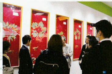
文山三七研究所見学