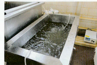
超音波水処理、オゾン水槽