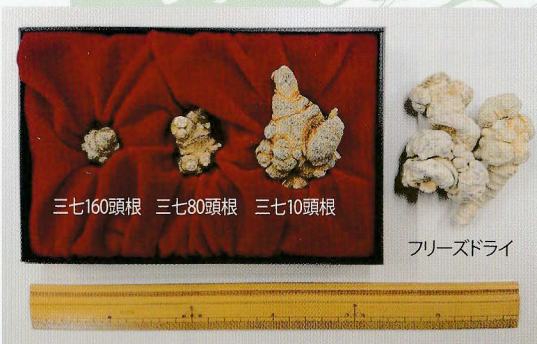
三七の等級(大きさ)比較

三七のランクは重さで決まります。三七は3年～4年の歳月をかけて収穫をします。そして熱風処理で8時間～30時間でカチカチの状態です。その状態で500gで10～19個を1等級三七と呼び、20～29個を2等級三七という具合に評価をします。