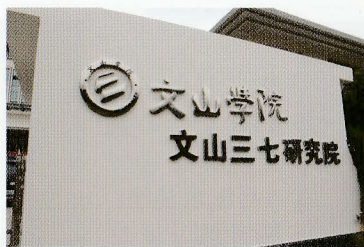
文山学院文山三七研究所