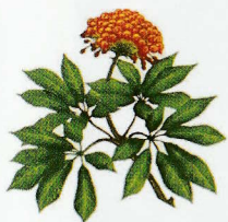
11月は三七の収穫時期です