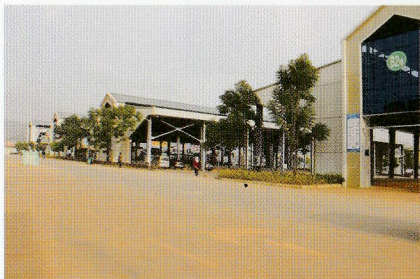
20年前と比較して巨大化した三七市場