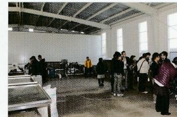
三七加工・洗浄工場全景

夢三七は、原産地文山の加工洗浄工場(高圧水洗浄、超音波、オゾン水、バブル洗浄、シャワー洗浄)農薬検査、重金属検査の工程を経て、熱風乾燥した未加工の三七を日本に輸入しています。